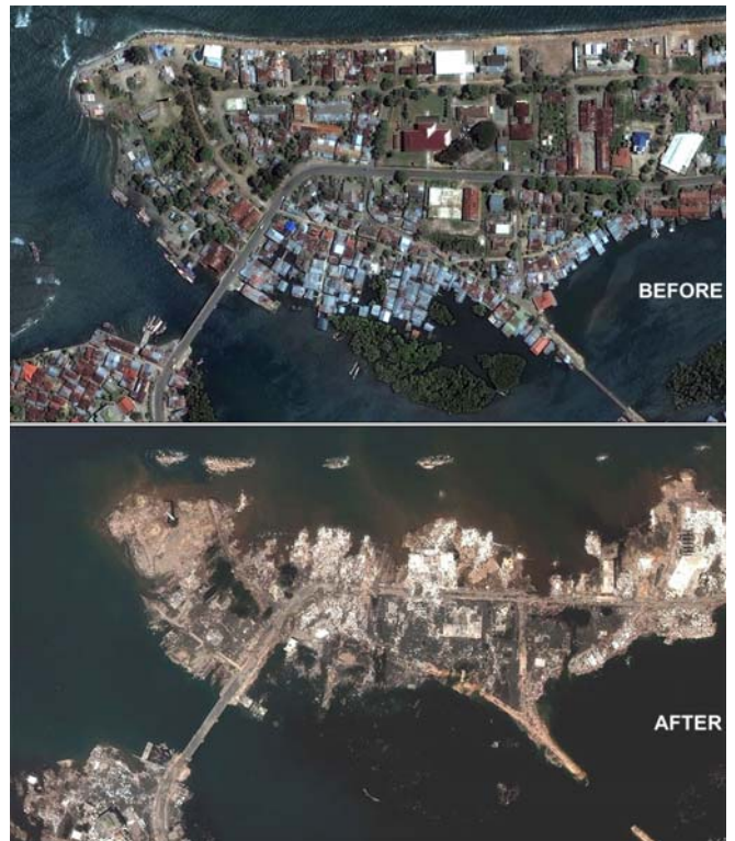
Một Bán đảo tại Indonesia bị Sóng Thần Tsunami tàn phá

và lửa pha với huyết bị quăng xuống đất. Một phần ba đất bị cháy, một phần ba loài cây bị cháy, và mọi giống cỏ xanh đều bị cháy. Vị thiên sứ thứ nhì thổi loa; bèn có một khối tựa như hòn núi lớn toàn bằng lửa bị ném xuống biển. Một phần ba biển biến ra huyết, một phần ba sanh vật trong biển chết hết, và một phần ba tàu bè cũng bị hủy hết. (Khải Huyền 8:6-9)